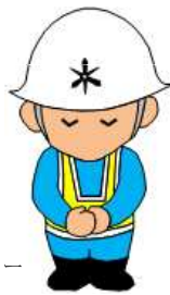
建設局イメージキャラクター けんくん