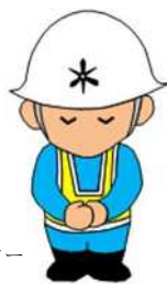
建設局イメージキャラクター けんくん